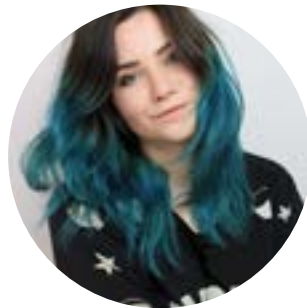
Wild Pastel Hair 85,8k