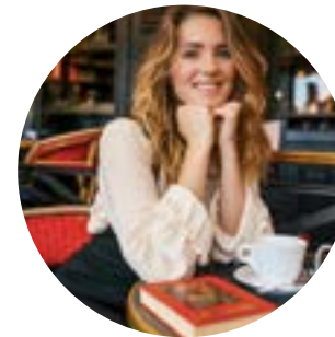
My Better Self 289k